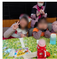
↑みんなでクリスマス会！メリークリスマス♪