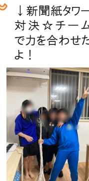
↓新聞紙タワー対決☆チームで力を合わせたよ！