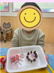
▲紙粘土でケーキやタコ をつくったよ★