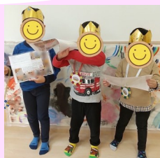
▲年長さんありがとうの会 では王冠やメダルをもらっ たよ♪